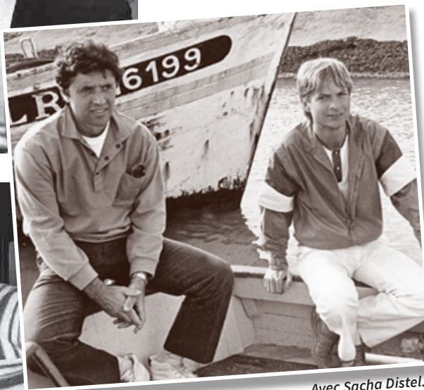
Avec Sacha Distel.