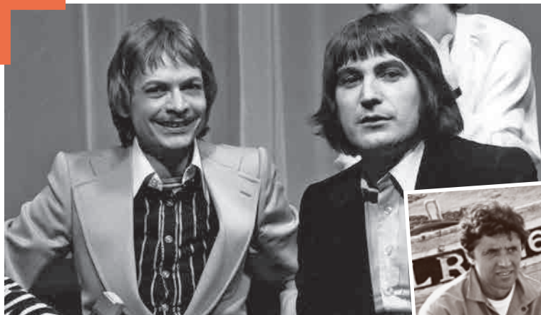
En interview avec Serge Lama.