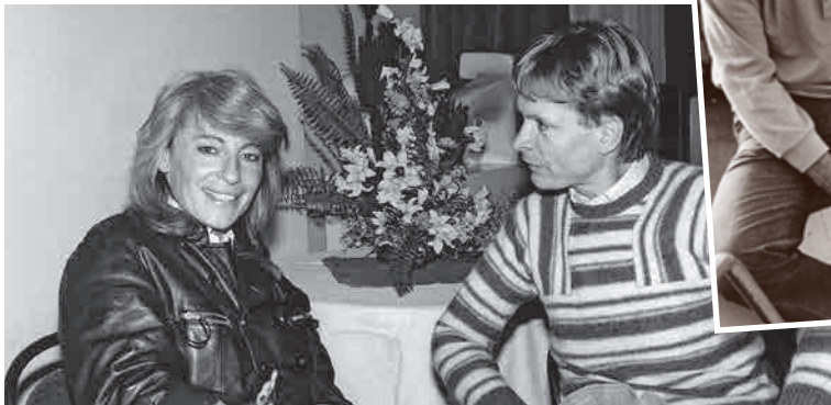
Avec Catherine Lara.

impliqué professionnellement. À 25 ans, ma vie sentimentale était très limitée. Un jour pour plaisanter, j'ai transmis un « bon pour un mari à compléter » à une technicienne de la radio avec qui je travaillais et que je trouvais mignonne. Elle l'a complété avec mon nom et une date de mariage et nous nous sommes bel et bien mariés ce jour-là ! De notre union sont nés un fils et une fille. Et nous avons adopté notre dernier fils. Ma femme et moi avons passé 17 ans ensemble