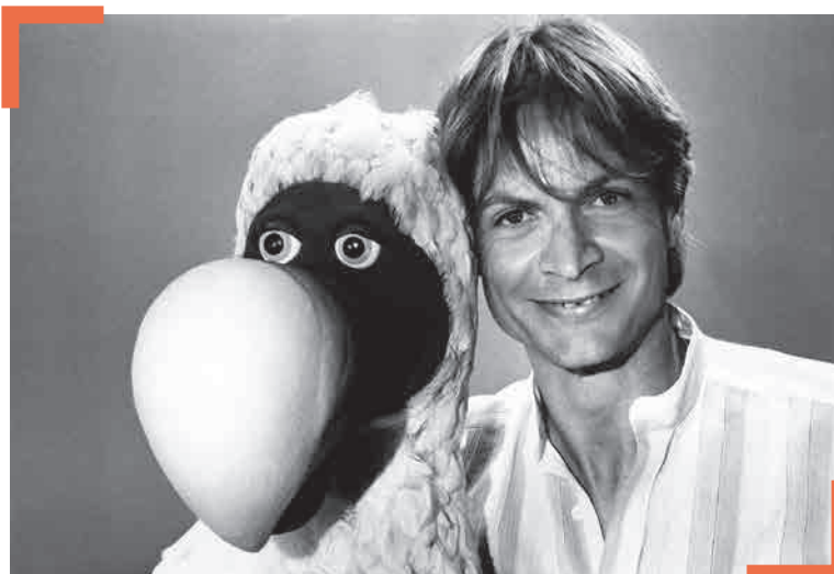
Avec la mascotte de l'émission culte pour enfant Dodu Dodo.