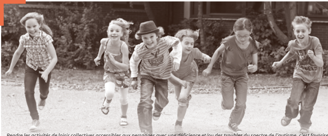
Rendre les activités de loisir collectives accessibles aux personnes avec une déficience et/ou des troubles du spectre de l'autisme, c'est favoriser leur épanouissement et leur autonomie.

Rendre les loisirs accessibles aux personnes avec une déficience et/ou des troubles du spectre de l'autisme, c'est favoriser leur épanouissement et leur autonomie. La Fondation Coup d'Pouce propose un accompagnement adapté pour une participation sans barrières.