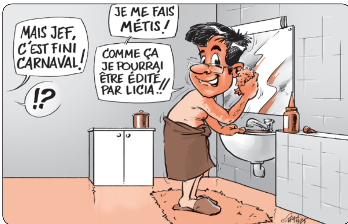
Lire notre grande interview pages 1-3.